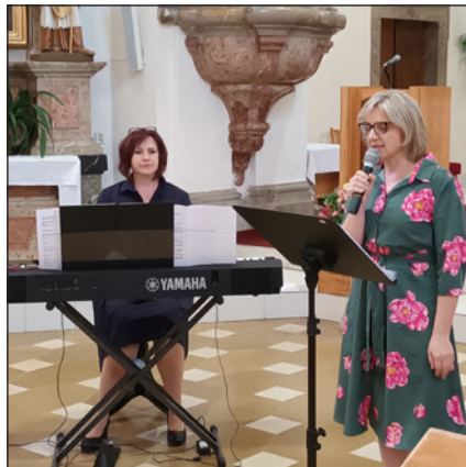
Noc kostelů – Půlhodinka s barokní hudbou