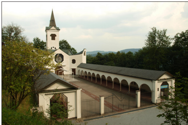
Poutní areál Panny Marie Pomocné ve Zlatých Horách