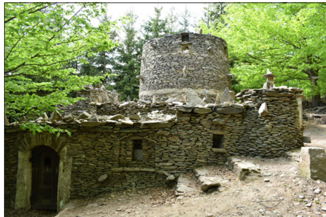
Hrádek Lipová nazývaný také Špacírštejn